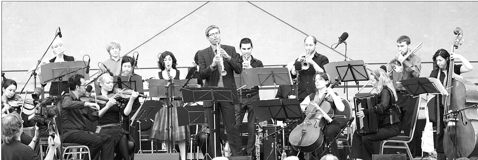
Gute-Laune-Musik macht nicht nur dem Publikum, sondern auch den Musikern des Ensembles Vinorosso selbst Spaß. Deswegen sind ihre Tänze und Volksweisen so mitreißend. Die Virtuosität jedes einzelnen Instrumentalisten und die swingenden Rhythmen aus Osteuropa machen das Hörvergnügen komplett.